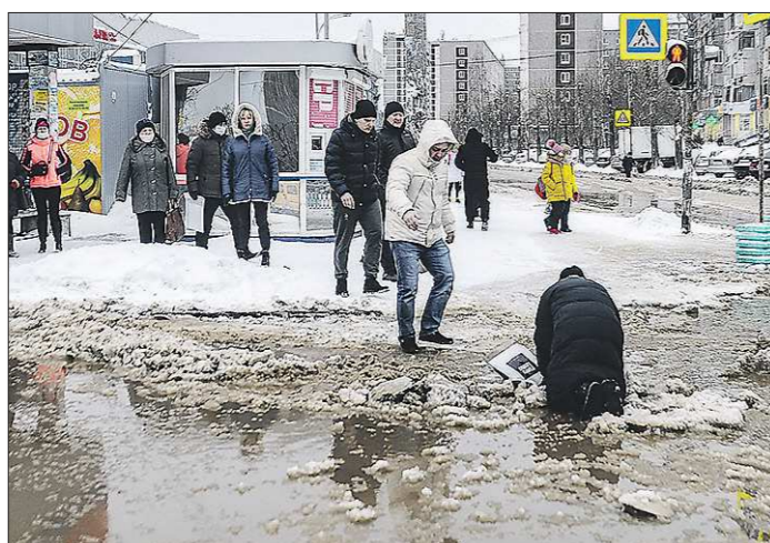
Разлив воды на Пехотинцев в Екатеринбурге стал опасным квестом для пешеходов

Также 15 января пришлось ударно поработать, устраняя прорывы на теплопроводах, энергетикам Кировграда. Они спасли от за-