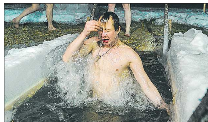
Ночные крещенские купания на Шарташе – проруби не пустовали до двух часов ночи

Что же получается – морозная уральская зима вновь стала для коммунальщиков неожиданностью? Подготовлено в соответствии с критериями, утвержденными приказом Департамента информационной политики Свердловской области от 09.01.2018 №1 «Об утверждении критериев отнесения информационных материалов, публикуемых государственными учреждениями Свердловской области, в отношении которых функции и полномочия учредителя осуществляет Департамент информационной политики Свердловской области, к социально значимой информации»