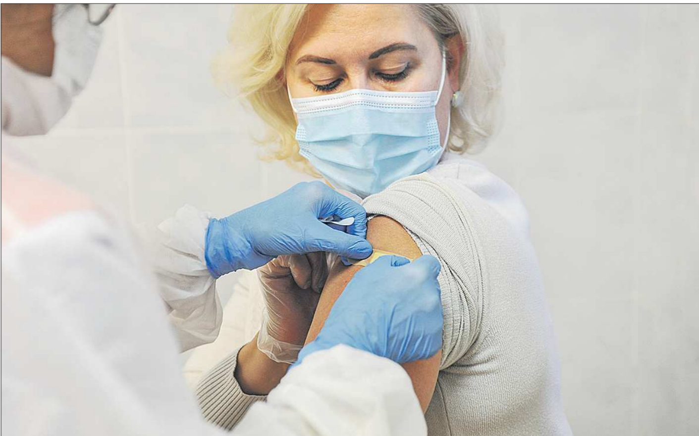
Всего в России прививку от коронавируса получили уже более полутора миллионов человек