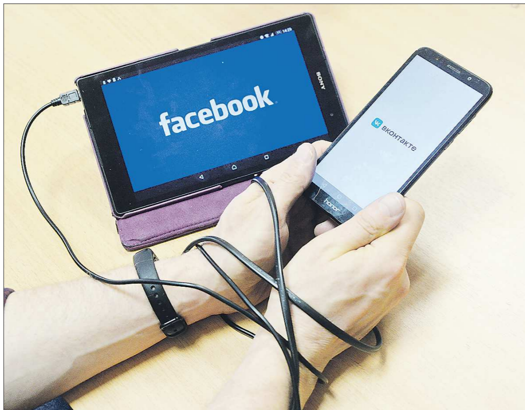
Альтернатив крупным игрокам на рынке соцсетей нет. Поэтому пользователям приходится принимать правила площадок

За последнюю неделю случилось сразу несколько скандалов с участием соцсетей. Они были связаны с новым пользовательским соглашением WhatsApp, с блокировкой аккаунта российской вакцины Sputnik V, с призывами американской НКО «Коалиция за безопасный интернет» исключить Telegram из App Store.