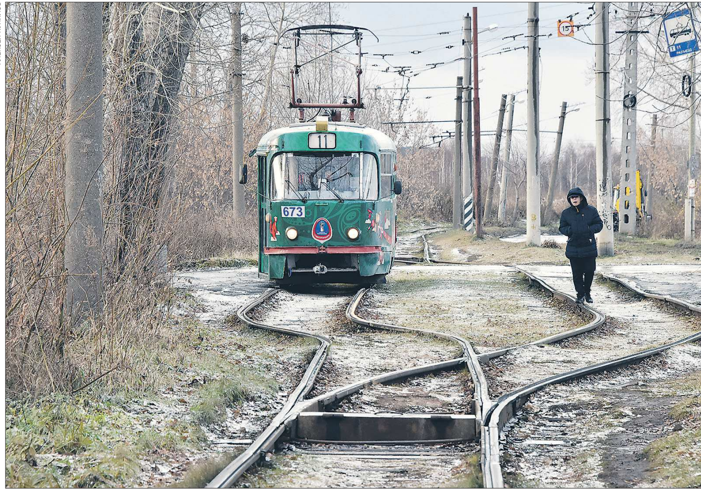
11-й трамвайный маршрут является единственным общественным транспортом, который соединяет посёлок Большой конный с Екатеринбургом. Трамвай ездит по однопутной линии. На маршруте работают всего два состава: пока один едет в посёлок, другой возвращается в город. На этом месте трамваи дожидаются друг друга, чтобы разъехаться