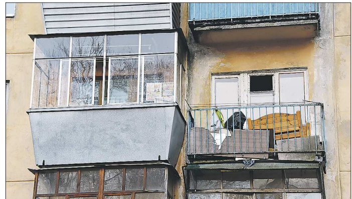
По правилам противопожарной безопасности хранить мебель и другие крупные вещи на балконах сейчас нельзя, как это было и раньше

Новые правила противопожарного режима, которые вступили в силу 1 января нынешнего года, вызвали ажиотаж в интернете. Многие СМИ стали наперебой сообщать, что теперь на лестничных клетках многоквартирных домов запрещается хранить велосипеды, коляски и другие вещи, а в подвалах жилых домов нельзя размещать кладовки. Но оказалось, что большинство этих сообщений не совсем верны - кардинальных изменений не так много.