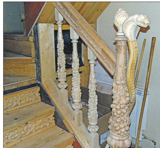
Лестница, ведущая на второй этаж, разительно отличается от среднестатистических лестниц