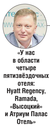
«У нас в области четыре пятизвездочных отеля: Hyatt Regency, Ramada, «Высоцкий» и Атриум Палас Отель»