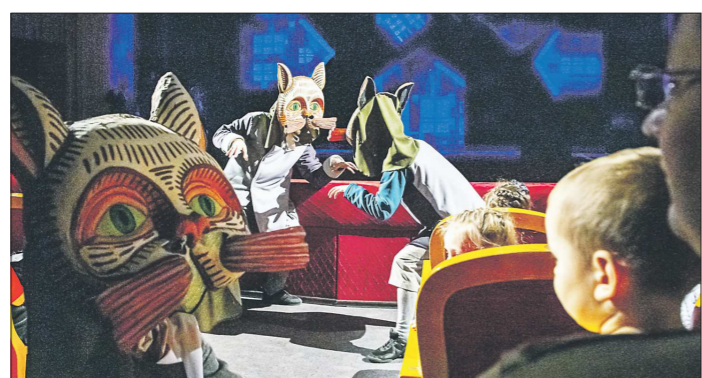
Спектакль «Серебряное копытце» — настоящий подарок для детской аудитории. Недаром помимо «Маски» он также номинирован на национальную премию в области театрального искусства для детей «Арлекин». На этот конкурс артисты поедут в начале лета в Санкт-Петербург

Мы уже писали, что с 2012 года Екатеринбургский театр оперы и балета ни разу не оставался без заветной на-