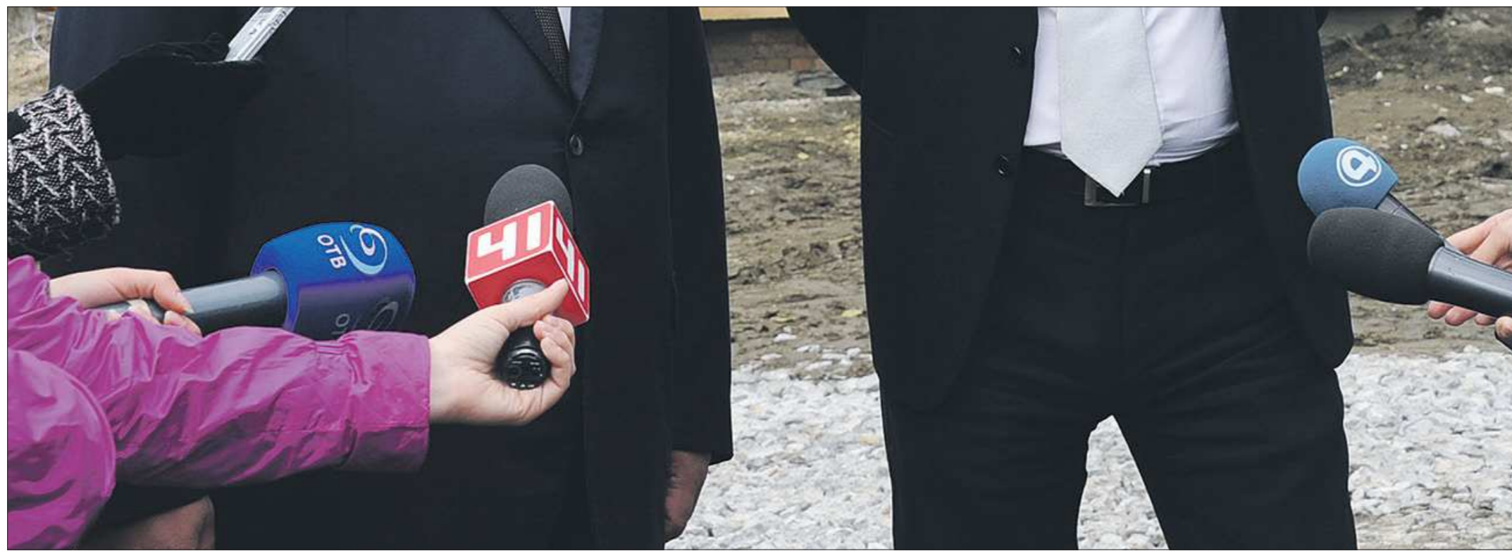
ОТВ, «Четвёртый канал» и «Студия-41» сохраняют свою независимость, так что освещать события и мероприятия по-прежнему будут телевизионщики с разных свердловских каналов