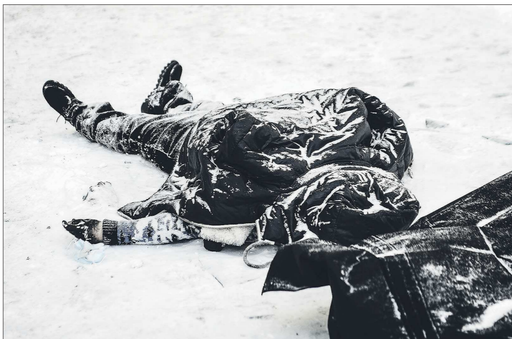
Как сообщили «Облгазете» в пресс-службе регионального ГУ МВД, к моменту подготовки материала не была установлена личность только одного погибшего, тело которого сильно обгорело. Тела троих несколько часов оставались у подъездов

Первая послепраздничная неделя в Екатеринбурге началась с трагедии. В ночь с 11 на 12 января в двух-подъездной девятиэтажке по адресу улица Рассветная, 7 произошел пожар, который унёс жизни восьми человек - семи взрослых и одного ребёнка. Очаг возгорания (в квартире №4 на втором этаже) был невелик по площади - 30 квадратных метров. Но люди погибли также на пятом и на девятом этажах - из-за отравления угарным газом.