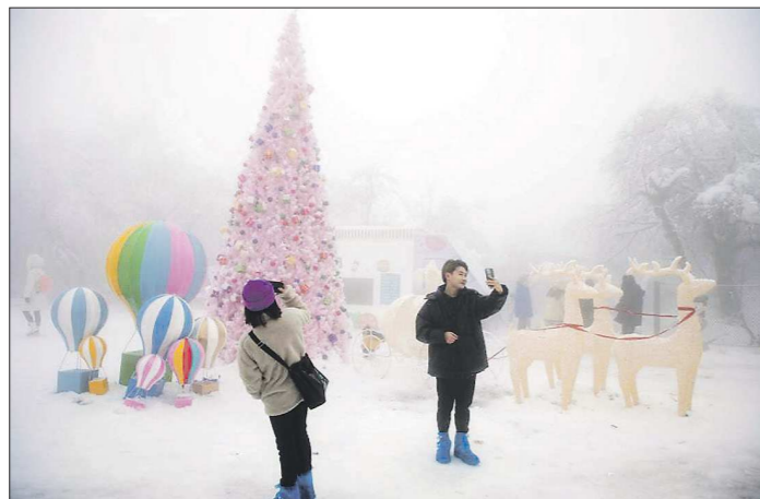
В преддверии западного Нового года в разных частях Китая проходят рождественские ярмарки. На фото – фестиваль льда и снега в горах Эмэйшань провинции Сычуань.

Большинство россиян привыкли считать, что в КНР встречают Новый год исключительно по лунному календарю. С древних времён это происходит в конце января – начале февраля. Но не чужды китайцы и европейского Нового года – его стали отмечать в Поднебесной с 1949 года, когда первый председатель Коммунистической партии Китая Мао Цзэдун провозгласил 1 января государственным праздником и выходным днём. Сделано это было для того, чтобы сотрудничество КНР с другими странами мира было более удобным.