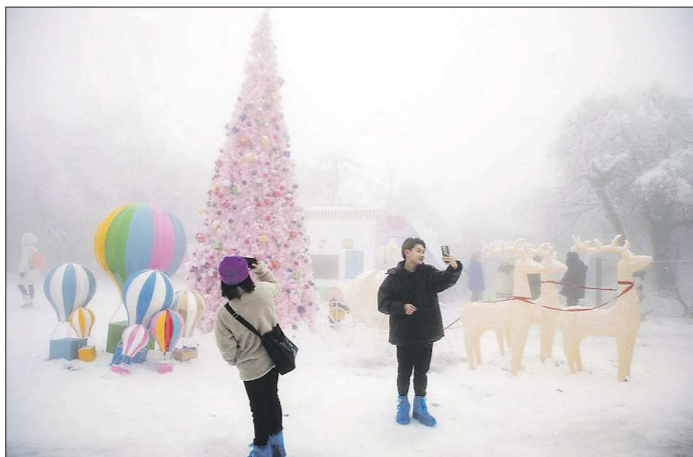
В преддверии западного Нового года в разных частях Китая проходят рождественские ярмарки. На фото – фестиваль льда и снега в горах Эмэйшань провинции Сычуань.

Большинство россиян привыкли считать, что в КНР встречают Новый год исключительно по лунному календарю. С древних времён это происходит в конце января – начале февраля. Но не чужды китайцы и европейского Нового года – его стали отмечать в Поднебесной с 1949 года, когда первый председатель Коммунистической партии Китая Мао Цзэдун провозгласил 1 января государственным праздником и выходным днём. Сделано это было для того, чтобы сотрудничество КНР с другими странами мира было более удобным.