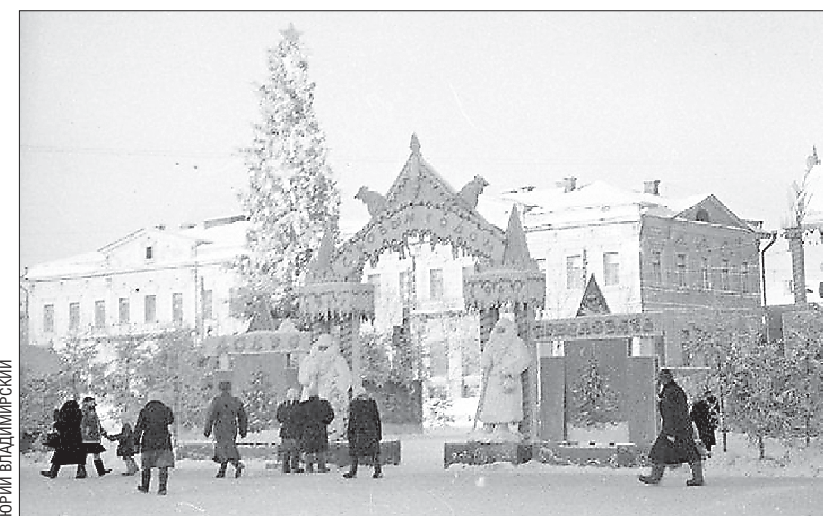
Ледовый городок на центральной площади Свердловска в первый послевоенный Новый год