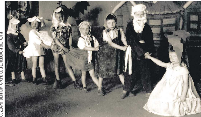
«Сказка про репку». Новогоднее представление для детей сотрудников Государственного Эрмитажа во время эвакуации в Свердловске, 1942 год

нить их полагалось всем заводам, союзам и колхозам. Трудовые коллективы брали на себя конкретные обязательства и на следующий 1942 год. Письмо это нужно было подписать лично – на торжественных новогодних митингах и собраниях. Все годы войны коллективные, практически ритуальные, подписания таких писем – своеобразных «клятв» – были едва ли не главным атрибутом празднования Нового года на Урале.