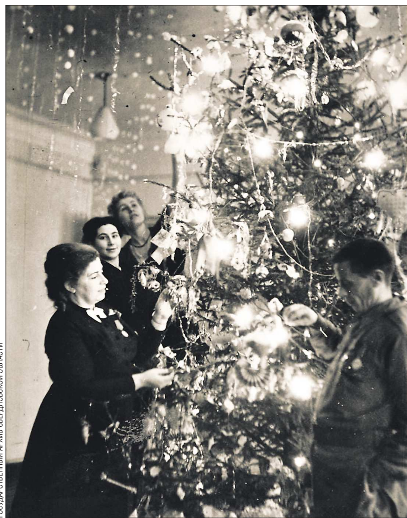
Украшение новогодней ёлки в одном из домов культуры Среднего Урала, 1944 год

Новый год в СССР был сугубо светским праздником, без какой-либо привязки к религии. Вместо Николая Угодника граждан стал поздравлять Дед Мороз, у которого в 1937 году появилась внучка – Снегурочка. Поначалу выходного в этот день не было, его ввели лишь с