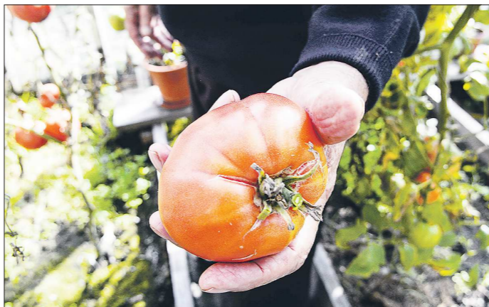
Особым спросом у садоводов сегодня пользуются томаты с жёлтыми, оранжевыми и розовыми плодами. Гибрид Наставление — один из таких

— Из томатов, помимо Наставника, это сорт Затеяник с первыми плодами, созданный совместно с агрофирмой «Агротомсом». Оранжевоплодный гибрид Наставление — такое название ему дали неслучайно. Его плоды красивого оранжевого цвета и