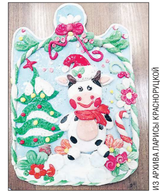
Панно из теста разрисовано обычными красками