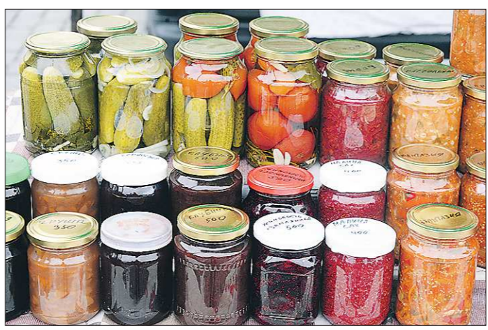
Уральские садоводы признаются, что ещё десять лет назад делали в два-три раза больше заготовок, чем сейчас