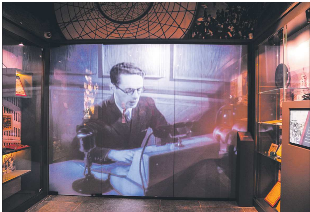
Стекло переменной прозрачности выступает в роли экрана...

Место выбрано не случайно. Считается, что именно в доме на пересечении улиц 8 Марта и Радищева находилась студия, в которой записывались сводки Совинформбюро. И голос Левитана звучал вовсе не из Москвы, а из Свердловска. Прямых документов, подтверждающих это, вроде бы не сохранилось (все-таки Левитан работал в Свердловске в обстановке секретности), но в документальном фильме «Говорит Свердловск» есть свидетельства людей, лично видевших легендарного диктора.