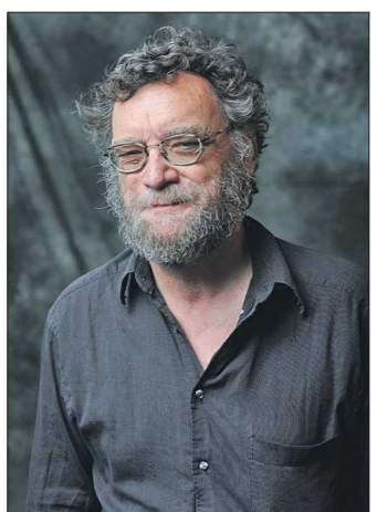
Майкл Сузник, автор нескольких романов, огромного количества повестей, рассказов, эссе и статей

На старейшем в нашей стране фестивале фантастики «Аэлита», который в этом году был проведен онлайн, названы лауреаты. Главную премию XXXVII онлайн-конвента получил американский фантаст Майкл Сузник .