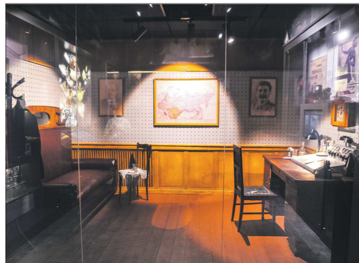
...а за ним – реконструкция радиостудии