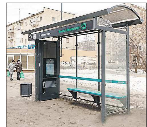
Сейчас новые «умные» трамвайные остановки на «Буревестнике» и «Волгоградской» тестируют