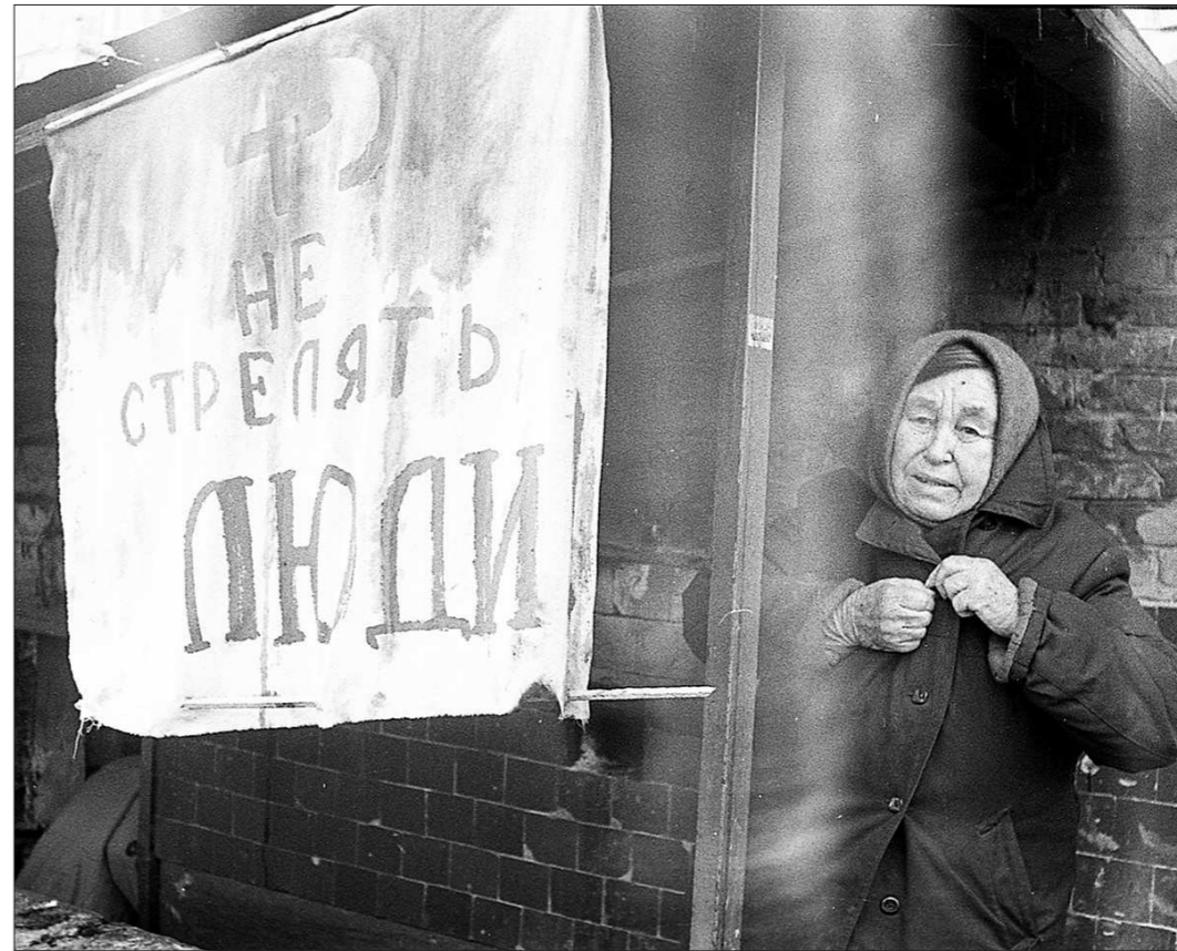
«Нам показалось, что русские женщины, живущие в подвалах, готовы были рассказать нам много интересного о предвоенной жизни в городе, но опасались соседней чеченцев»

Подготовлено в соответствии с критериями, утвержденными приказом Департамента информационной политики Свердловской области от 09.01.2018 №1 «Об утверждении критериев отнесения информационных материалов, публикуемых государственными учреждениями Свердловской области, в отношении которых функции и полномочия учредителя осуществляет Департамент информационной политики Свердловской области, к социально значимой информации».