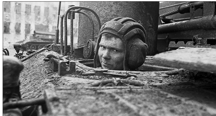
«Возле больницы комплекс бронированный тягач расчищал улицу от пострадавшей в боях техники. Из люка БТС выглянул совсем ещё мальчишка, и, увидев нас, штатских, едва заметно улыбнулся»