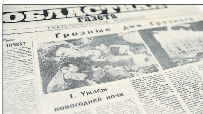
Репортажи в «Областной газете» из Грозного выходили 3, 7, 8, 10 и 15 февраля 1995 года