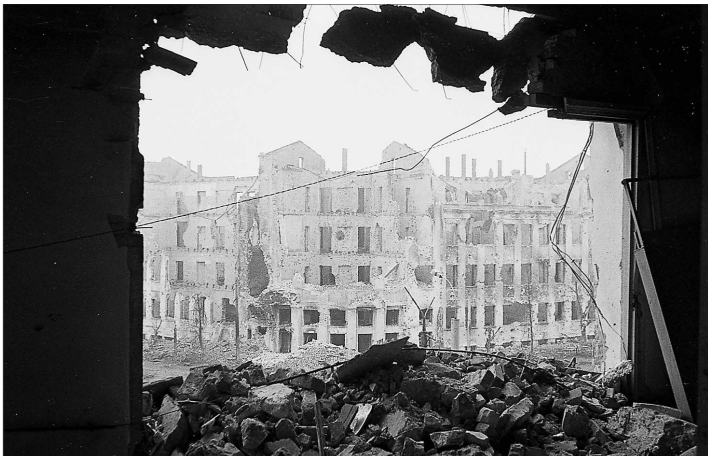
«Везжая в Грозный, мы держали в памяти сюжеты из теленовостей и были готовы к тому, что пред нами предстанет почти разрушенный город, но увиденное своими глазами превзошло все ожидания» («ОГ», 1995 год)