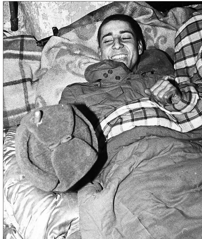
«Один из бойцов 276-го полка, смеясь, показал нам отверстие в шапке, оставленное чеченской пулей. Наверное, только так, с улыбкой, можно на войне быть сильнее смерти»