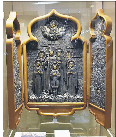
Список иконы, подаренной невыясними иконисцами Владимиру Путину