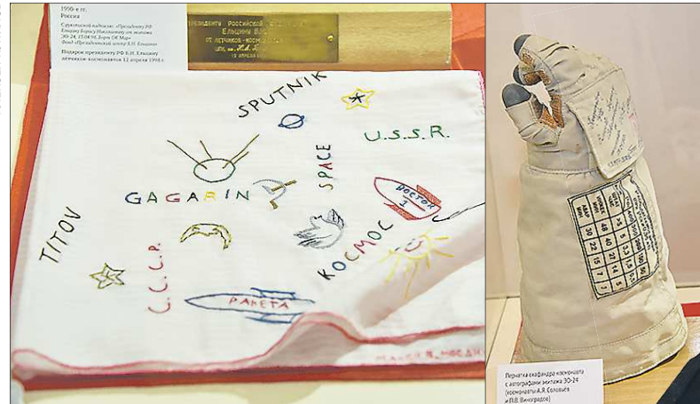
В начале 1960-х годов космосом «болели» даже на Кипре – подарок Юрию Гагарину от кипрского мальчика. Рядом – космическая перчатка с автографами Анатолия Соловьёва и Павла Виноградова