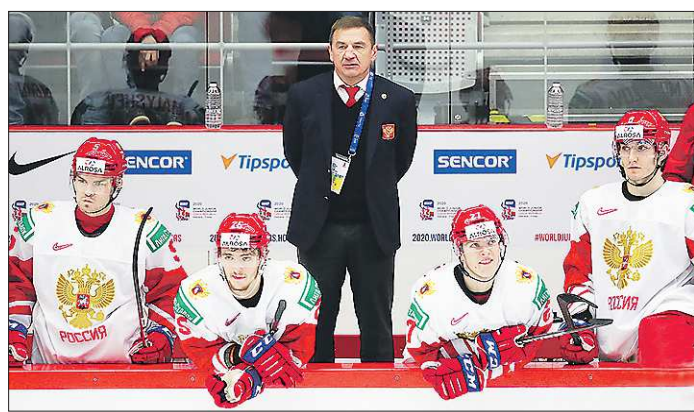
До назначения главным тренером национальной команды Валерий Брагин долгое время являлся наставником молодёжной сборной России

Подготовлено в соответствии с критериями, утверждёнными приказом Департамента информационной политики Свердловской области от 09.01.2018 №1 – «Об утверждении критериев отнесения информационных материалов, публикуемых государственными учреждениями Свердловской области, в отношении которых функции и полномочия учредителя осуществляет Департамент информационной политики Свердловской области, к социально значимой информации».