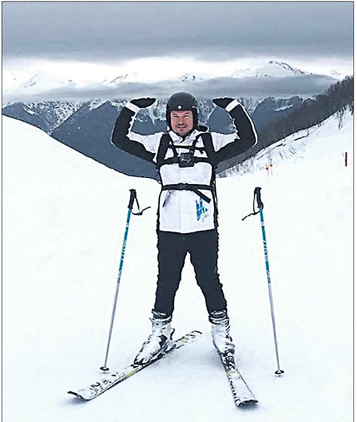
Мэр Сысерти Дмитрий Нисковских смело покоряет горные вершины на лыжах. Благо спортивная сноровка — отличная.