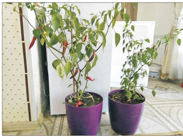
Такие кусты красных перцев не просто дают богатый урожай жгучих приправ прямо в квартире, но и становятся достойным украшением дома