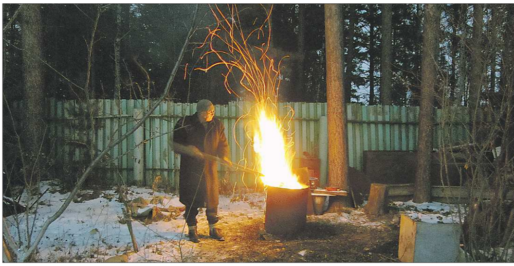
Территория, где планируют сжигать мусор, должна быть очищена от сухостоя, сухой травы, валежника и порубочных остатков в радиусе 10 метров

Согласно действующим сейчас правилам противопожарного режима, всё перечисленное касается только территорий общего пользования, со следующего же года к ним добавляются и частные земли. Однако тотального запрета на разведение открытого огня и сжигания