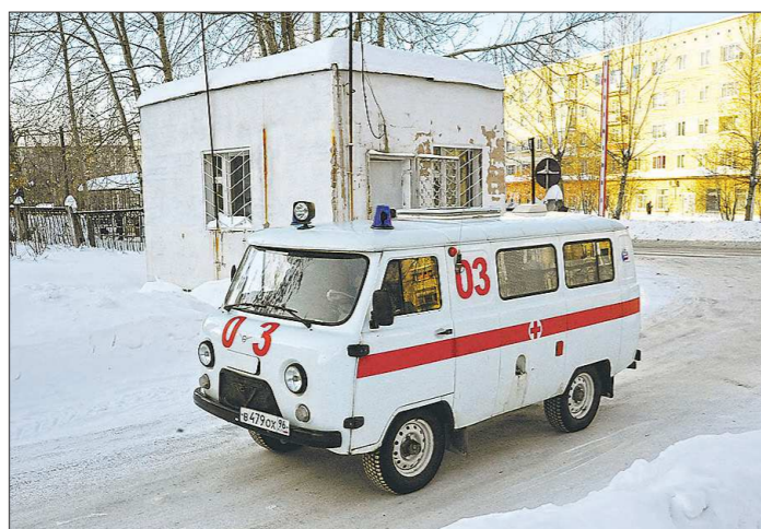
Жители сёл в окрестностях Серова отстояли оказание неотложной помощи в 2021 году, но это не значит, что в других муниципалитетах Свердловской области оптимизация здравоохранения будет свернута

В начале декабря серовские СМИ сообщили о