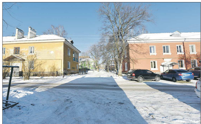
Справа – отремонтированный дом №55. Слева – дом №57, о котором идёт речь в материале. Эти здания – ровесники, но судьба у них – разная

12-квартирный дом по адресу Карла Либкнехта, 57 в Ревде выглядит сиротой на фоне соседских двухэтажек – тоже 1949 года постройки, но ухоженных и аккуратных. Три года назад он «застрял» между капитальным ремонтом, на который надеются жильцы, и расселением. Всё это время здание остаётся без управления и без решения даже текущих проблем.