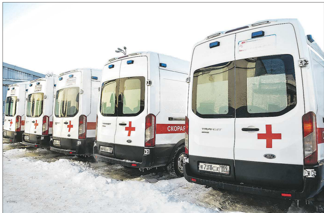
Покупка и обслуживание одного реанимобиля в разных городах обойдётся областному бюджету в разную сумму: в Первоуральске - в 17,3 млн рублей, в Каменске-Уральском - в 19,2 млн, а в Нижнем Тагиле - в 19,7 млн

Станции скорой медицинской помощи в Нижнем Тагиле, Каменске-Уральском и Первоуральске с февраля 2021 года переводят на аутсорсинг. Люди напуганы и обещают «стоять до последнего». Это обычный страх перед переменами, или аутсорсинг в условиях пандемии действительно способен обрушить систему оказания медицинской помощи в крупнейших городах Среднего Урала?