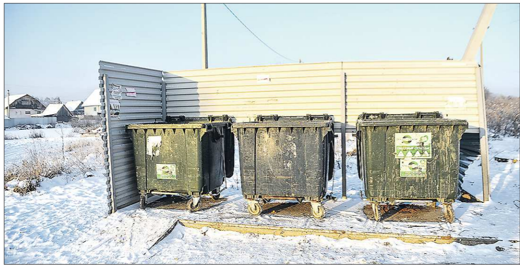
Сдать отчёт об обращении с ТКО за 2020 год необходимо всем СНТ Свердловской области