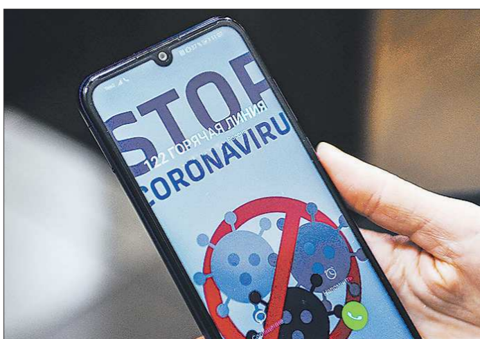
При звонке на номер 122 автоматический голос сразу информирует, какой вы в очереди на ответ оператора

То, что такая горячая линия будет востребована, не вызвало сомнений. За прошедший месяц не было ни дня, чтобы в редакцию «Областели» не позвонили читатели с жалобами на то, что не могут дозвониться до поликлиники, вызвать скорую помощь, открыть больницу или дождаться результата теста на коронавирус (см. «ОГ» №211 от 12.11.2020). Поликлиническая служба и скорая помощь оказались не готовы к такому валу звонков, которые спровоцировал подъем заболеваемости коронавирусом и ОРВИ этой осенью. В середине ноября в регионе увеличили количество телефонных линий в каждой поликлинике, о чём сообщил заместитель губернатора Свердловской области Павел