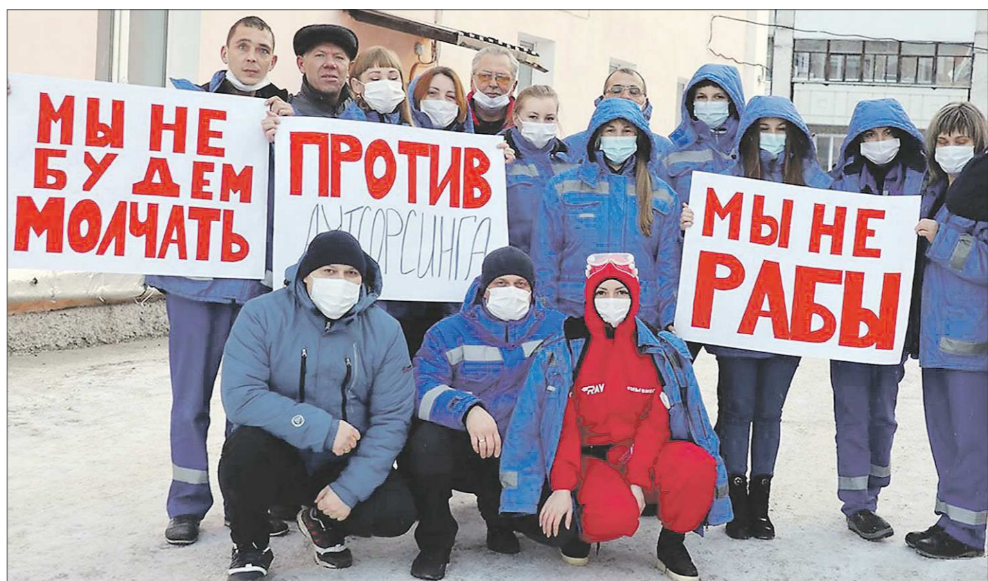
Станции скорой медицинской помощи в Нижнем Тагиле, Каменске-Уральском и Первоуральске с февраля 2021 года переводят на аутсорсинг. Люди напуганы и обещают «стоять до последнего». Это обычный страх перед переменами, или аутсорсинг в условиях пандемии действительно способен обрушить систему оказания медицинской помощи в крупнейших городах Среднего Урала?