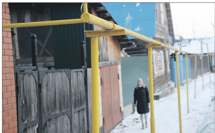
Газопровод проложат вдоль жилых домов, точную дату начала строительства власти пока не называют