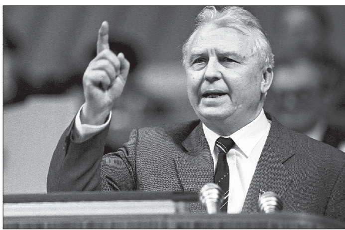
На XXVIII съезде КПСС в 1990 году Егор Лигачёв выступил с критической речью и... был выведен из состава Политбюро ЦК

Ведь это при Лигачёве Томская область, которой он руководил с 1965 по 1983 год, завовавшая ранее значительную часть продуктов питания из других регионов страны, стала полностью обеспечивать себя основными видами продовольствия. Причём годы его руководства областью были отмечены успехами не только в сфере АПК – при нём, например, в регионе была начата нефтедо-