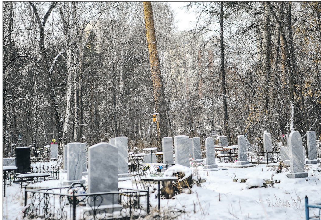
В 2010 году проектировщики из Иллинойса предложили проект «высотного» кладбища, которые сегодня есть уже в нескольких странах.

Ещё три закрыты, остальные относятся к категории ограниченных для захоронения - там принимают только родственные похороны.