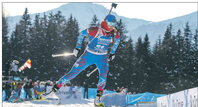
Биатлонисты в этом сезоне должны совершить минимум переездов