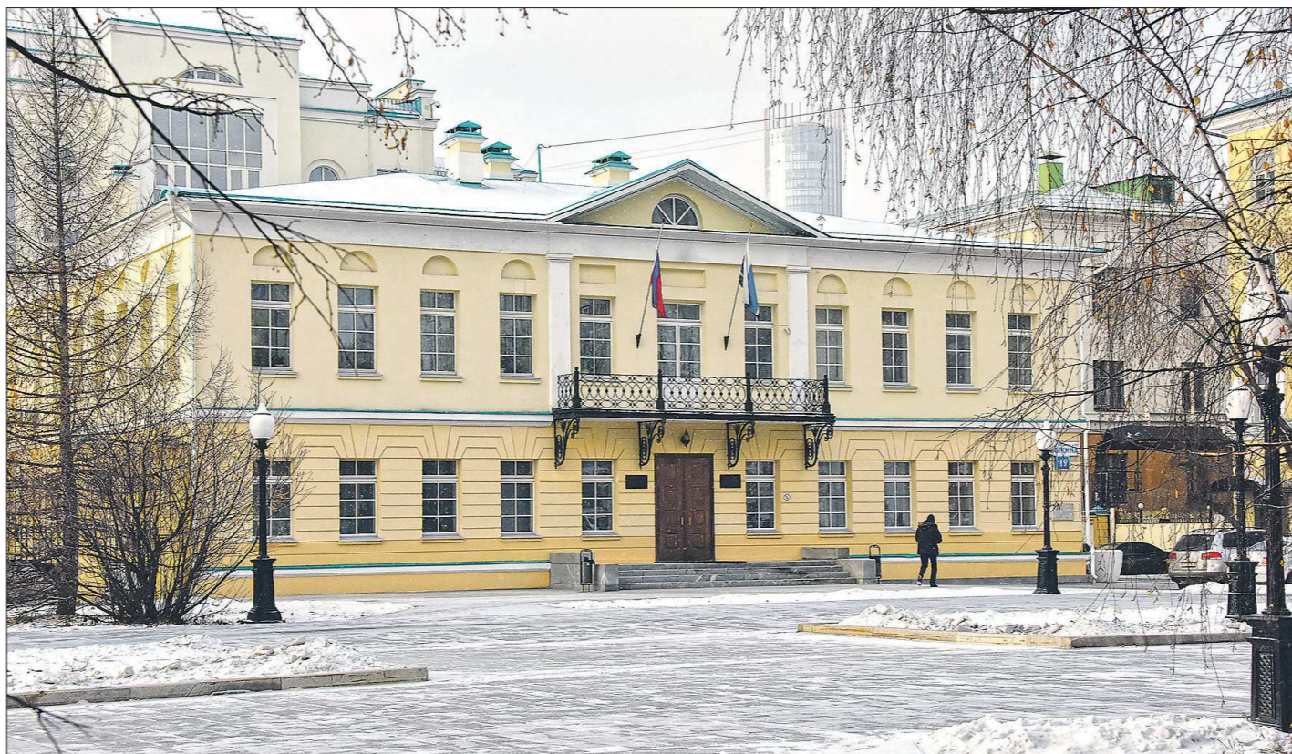
Двухэтажное здание, где сегодня находится Уставный суд Свердловской области (ул. Пушкина, 19), построено между 1812 и 1819 годами. Изначально в нём находилась почтовая станция. Именно здесь останавливались декабристы, следовавшие в Сибирь на каторгу и ссылку

Уставные суды в регионах России себя изжили: они уйдут из нашей жизни через два года