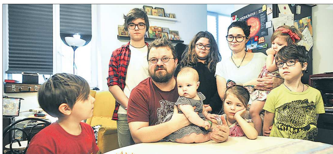
По мнению отца Или, Рождественский пост — путь, который должен объединять семью

28 ноября наступает Рождественский пост длинной в сорок дней. Это последний в уходящем году пост, который готовят православные верующие к встрече Рождества Христова.