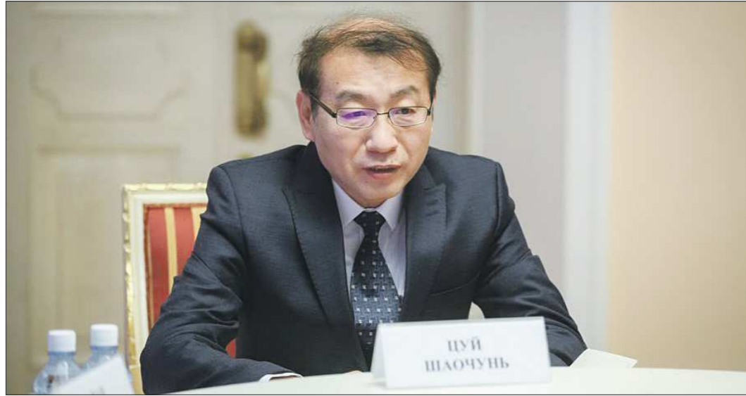
Генеральный консул КНР в Екатеринбурге господин Цуй Шяочунь уверен, что рост китайской экономики даст стимул для аналогичных процессов в мировой экономике

Во втором квартале текущего года ВВП Китая успешно преодолел отрицательные значения и достиг положительных отметок.