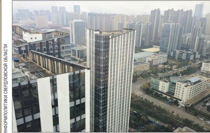
Китаю удалось восстановить экономику за счёт активного развития жилищного строительства, коммунального хозяйства и информационных технологий

В-третьих, усилилась ведущая роль новых драйверов развития. За 9 месяцев добавленная стоимость высокотехнологичной обрабатывающей промышленности выросла на 5,9 процента сверх установленного размера.