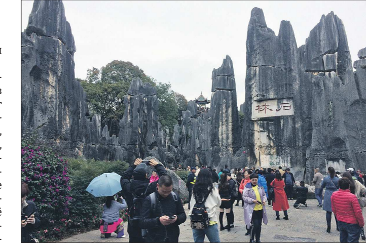
Дополнительным фактором для роста экономики КНР стал внутренний туризм и другие отрасли сферы услуг