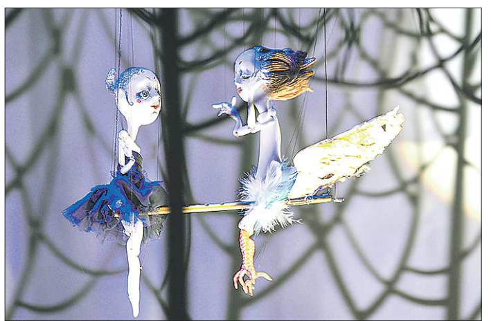
Юная Кармен не поддавалась на провокации Ангела