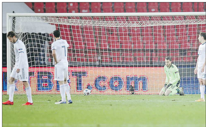
Сборная России потерпела самое крупное поражение за 16 лет

Сборная России по футболу провалила решающий матч года. Подопечные Станислава Черчесова потерпели разгромное поражение от Сербии (0:5), потеряли первую строчку в рейтинге Лиги наций, а также вылетели из состава второй корзины при жеребьевке отборочного турнира к ЧМ-2022.