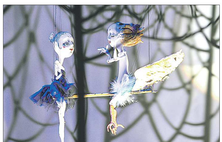
Юная Кармен не поддаётся на провокации Ангела