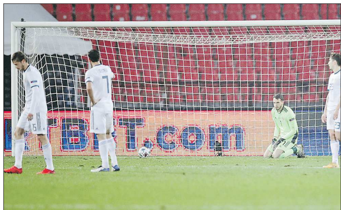
Сборная России потерпела самое крупное поражение за 16 лет