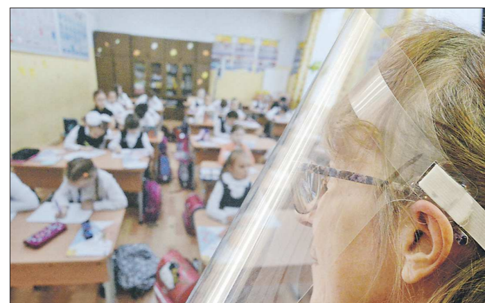
Носить или нет защитный экран во время урока – решает учитель

Подготовлено в соответствии с критериями, утвержденными приказом Департамента информационной политики Свердловской области от 09.01.2018 №1 «Об утверждении критериев отнесения информационных материалов, публикуемых государственными учреждениями Свердловской области, в отношении которых функции и полномочия учредителя осуществляет Департамент информационной политики Свердловской области, к социально значимой информации»