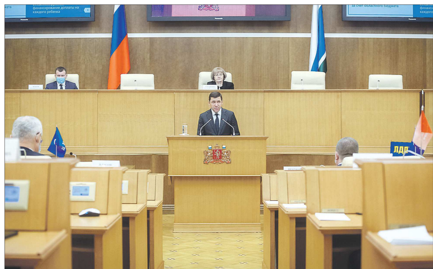
Выступление губернатора Евгения Куйвашева перед Заксобранием традиционно предшествовало первому чтению проекта главного финансового документа области