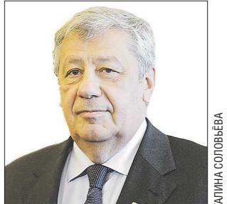
Аркадий Чернецкий возглавлял Екатеринбург с 1992 по 2010 годы

Российскому политику, члену Совета Федерации от Свердловской области и бывшему главе Екатеринбурга Аркадию Чернецкому присвоено звание «Почётный гражданин Свердловской области».