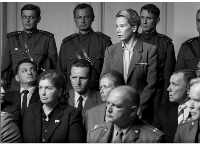
Юлия Высоцкая (в центре) сыграла в картине главную роль. Кстати, сама актриса родилась в Новочеркасске

– Насколько моя попытка разобраться в противоречиях жизни этого поколения будет понятна или прочувствована