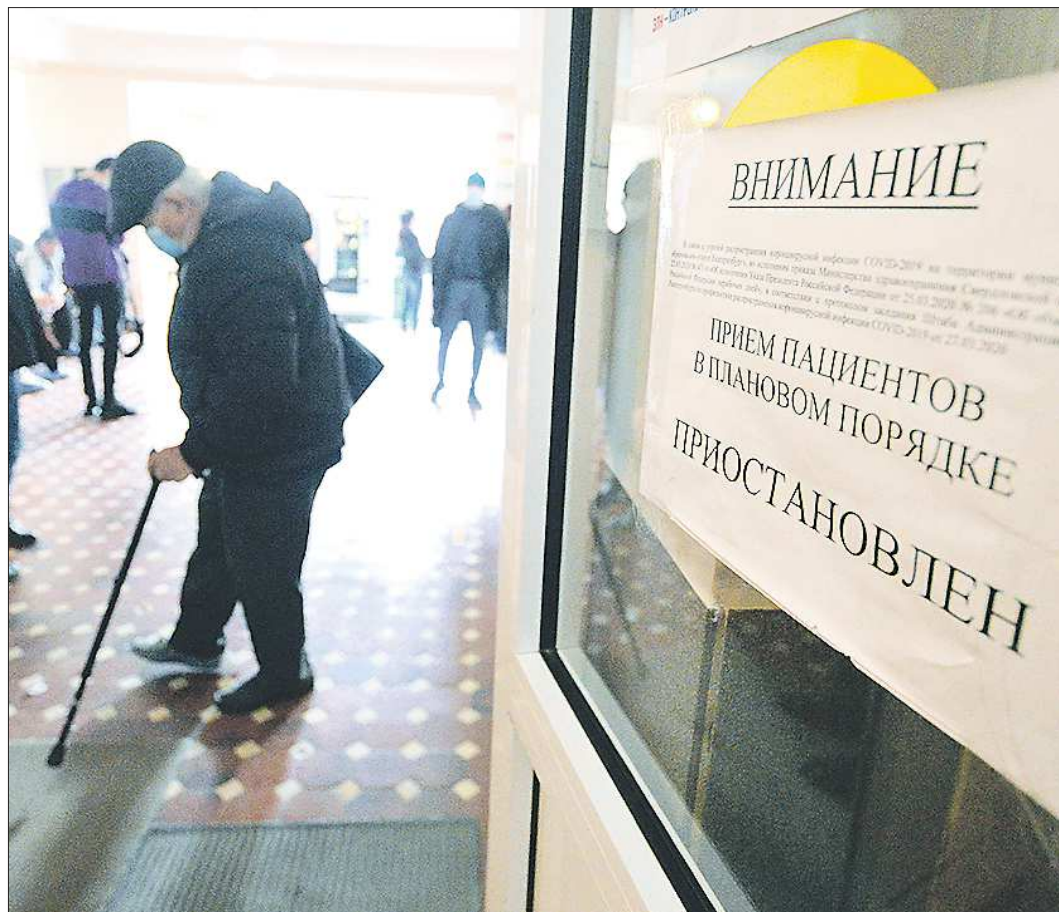
Приходящие в поликлинику на Ленина, 52 в Екатеринбурге сразу видят, что приём пациентов в плановом порядке там приостановлен