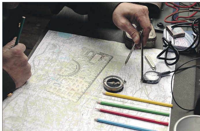
К поясу нестабильности вокруг России подключают Молдавию

Вчера стало известно, что на прошедшем в минувшее воскресенье втором туре выборов президента Молдавии победу одержала Майя Санду - лидер партии, выступающей за дальнейшее сближение страны с Евросоюзом и НАТО.