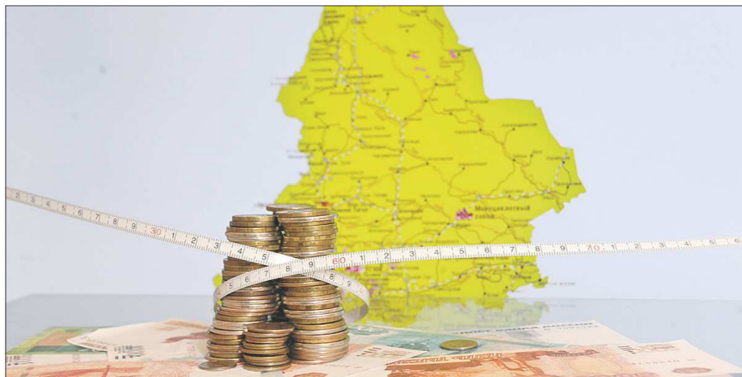
Согласно законопроекту, доходы областного бюджета в 2021 году могут составить около 259,1 млрд рублей, а расходы – около 299,7 млрд рублей. Учитывая дефицит в 40,6 млрд рублей, региону придётся затянуть пояса

Сегодня свердловское Заксобрание рассмотрит в первом чтении проект закона о бюджете области на 2021 год и плановый период 2022–2023 годов. Ситуация осложняется затянувшейся пандемией коронавируса, из-за которой власти вынуждены затягивать пояса и задумываться о поисках дополнительных источников доходов. В интервью «Областете» замгубернатора – министр финансов Галина Кулаченко рассказала, за счёт чего власти планируют пополнить областную казну и почему отказать от формирования бюджета по «пессимистичному сценарию».