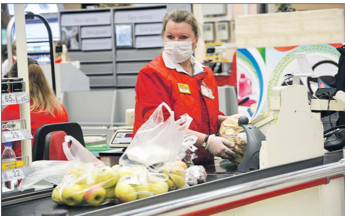
Из-за постоянного контакта с большим количеством людей кассиры входят в особую группу риска заражения COVID-19

Что касается статистики относительно мест инфицирования коронавирусом, то 39 процентов среди заболевших свердловчан отмечают, что причиной их заражения стали бытовые контакты: визит в гости, посещение мест массового пребывания