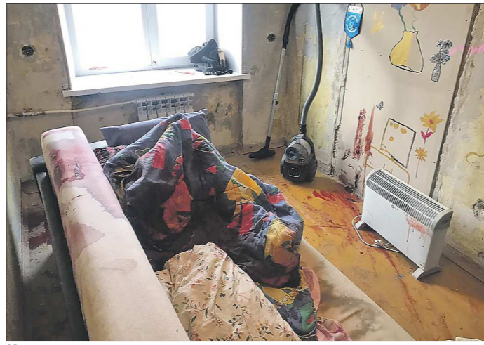
Интерьер комнаты показывает, что в квартире ведут далеко не примерный образ жизни