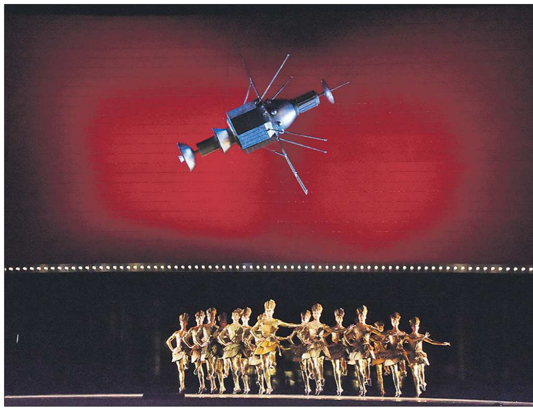
Балет «Приказ короля» был номинирован в девяти категориях, две из них «сыграли»

И самая тяжёлая ситуация с переносами получилась как раз у театра «Урал Опера Балет». Если оперу «Три сестры» коллектив успел представить в Москве до карантина, то вот балет «Приказ короля», «Вальпургиева ночь» и «Brahms party» в определённые сроки до столицы доехать не успели, как и балет «Шопен. Carte Blanche».