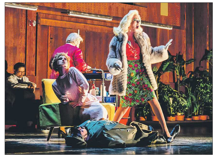
Опера «Три сестры» была представлена в девяти номинациях, а победила в двух главных