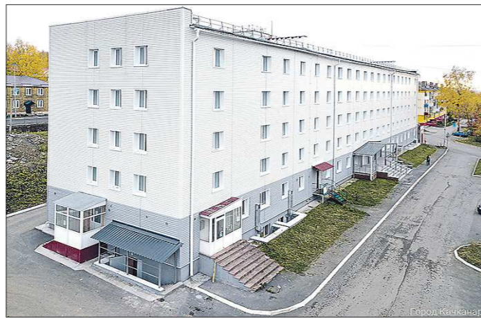
Свежеотремонтированный дом в Качканаре

Пятиэтажка 1971 года постройки. Ее возвели для проживания рабочих завода металлостроительных конструкций. В 90-е годы один подъезд заводчанам был отремонтирован и превращен в квартиры, остальная часть здания пришла в упадок и в 2003-м была пере-