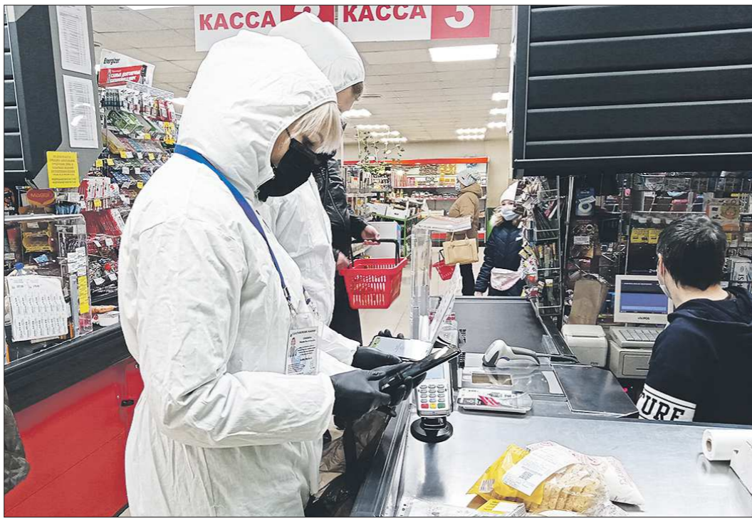
Волонтеры быстро, но тщательно выбирают продукты для пожилых людей в магазине