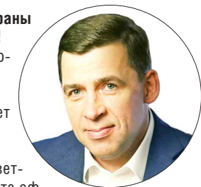
ДЕПАРТАМЕНТ ИНФОРМАЦИОННОЙ ПОЛИТИКИ

Губернатор Свердловской области Евгений КУЙВАШЕВ