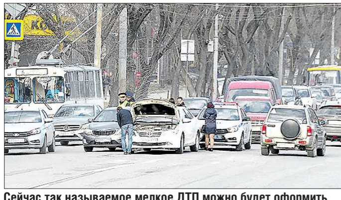
Сейчас так называемое мелкое ДТП можно будет оформить без привлечения ГИБДД, с помощью приложения

Подготовлено в соответствии с критериями, утвержденными приказом Департамента информационной политики Свердловской области от 09.01.2018 №1 «Об утверждении критериев отнесения информационных материалов, публикуемых государственными учреждениями Свердловской области, в отношении которых функции и полномочия учредителя осуществляет Департамент информационной политики Свердловской области, к социально значимой информации»