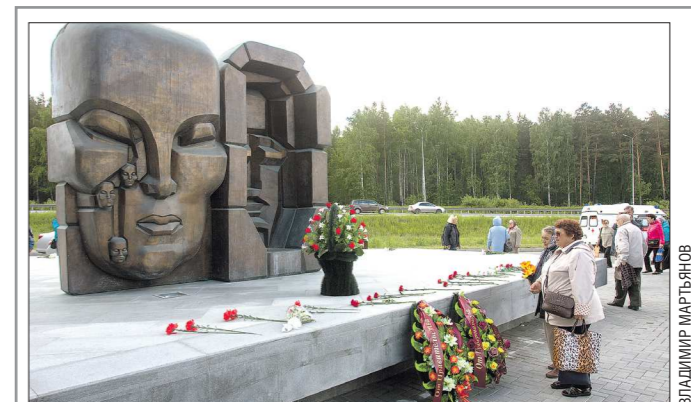
В 2017 году на мемориальном комплексе появился монумент «Маска скорби» скульптора Эрнста Неизвестного