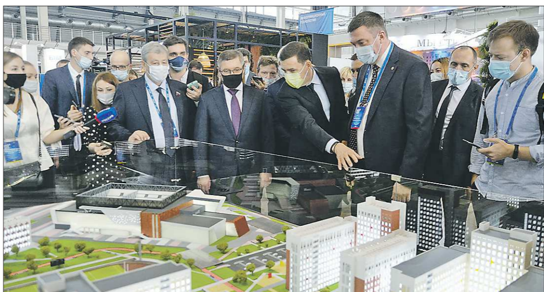
Евгений Куйвашев показал Владимиру Якушеву (на снимке – в тёмной маске рядом с губернатором), как будет выглядеть деревня Универсиады, которую планируют возвести недалеко от МВЦ «Екатеринбург-ЭКСПО», где проходит форум

Подготовлено в соответствии с критериями, утвержденными приказом Департамента информационной политики Свердловской области от 09.01.2018 №1 «Об утверждении критериев отнесения информационных материалов, публикуемых государственными учреждениями Свердловской области, в отношении которых функции и полномочия учредителя осуществляет Департамент информационной политики Свердловской области, к социально значимой информации».