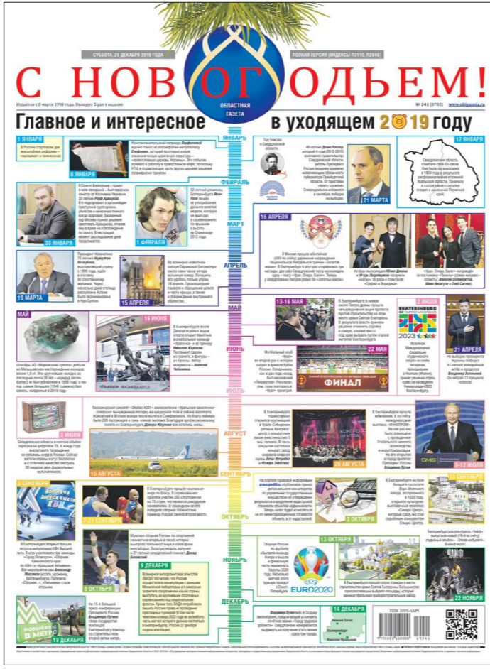
«Лучшее использование инфографики»