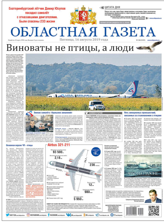
«Лучшая подача первой полосы»