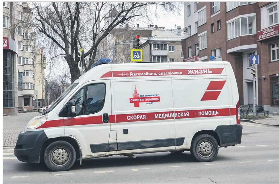
Из-за большого числа больных коронавирусом нагрузка на уральских медиков и скорые возросла, так что другая медицинская помощь всю весну и лето оказывалась ограниченно

Число умерших в нашем регионе в сентябре Росстат ещё не опубликовал. Но, опираясь на данные Управления ЗАГС Свердловской области за третий квартал, нетрудно вычислить, что в первом месяце осени смертность на Среднем Урале составила более 5 300 случаев. Само реги-