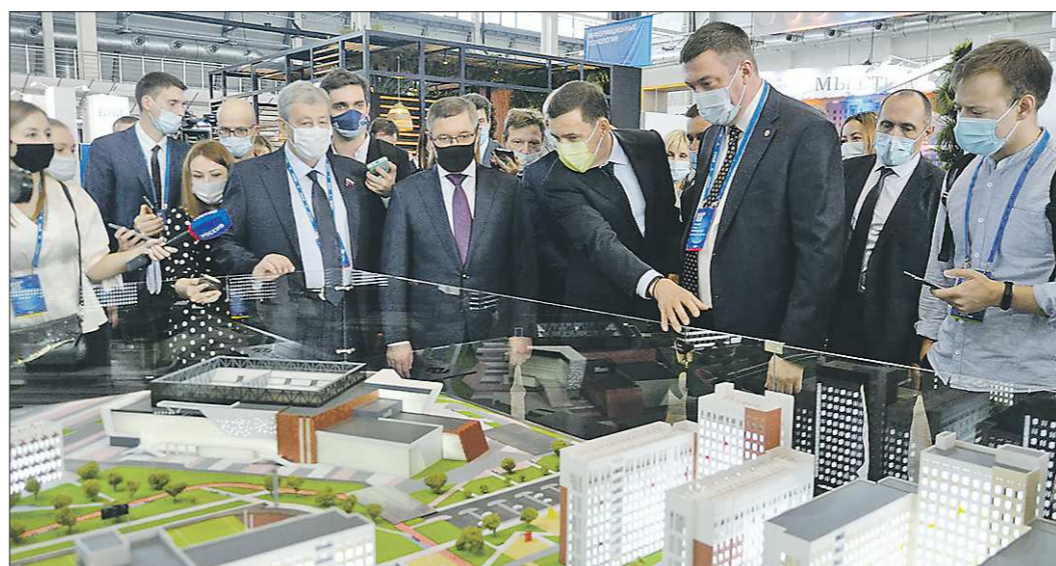
Евгений Куйвашев показал Владимиру Якушеву (на снимке – в тёмной маске рядом с губернатором), как будет выглядеть деревня Универсиады, которую планируют возвести недалеко от МВЦ «Екатеринбург-ЭКСПО», где проходит форум

Подготовлено в соответствии с критериями, утвержденными приказом Департамента информационной политики Свердловской области от 09.01.2018 №1 «Об утверждении критериев отнесения информационных материалов, публикуемых государственными учреждениями Свердловской области, в отношении которых функции и полномочия учредителя осуществляет Департамент информационной политики Свердловской области, к социально значимой информации».