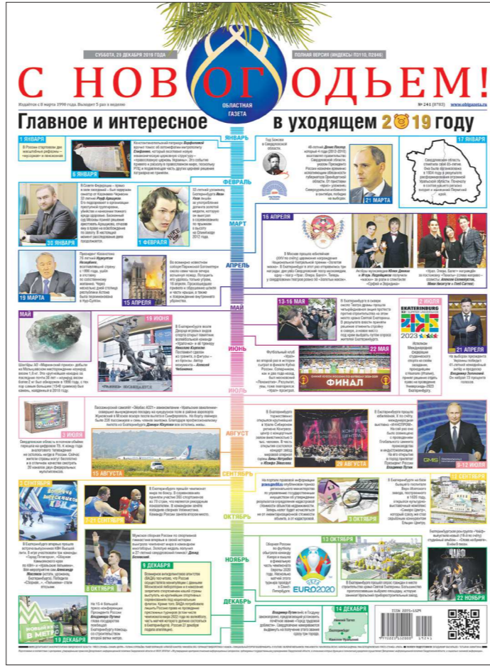
«Лучшее использование инфографики»