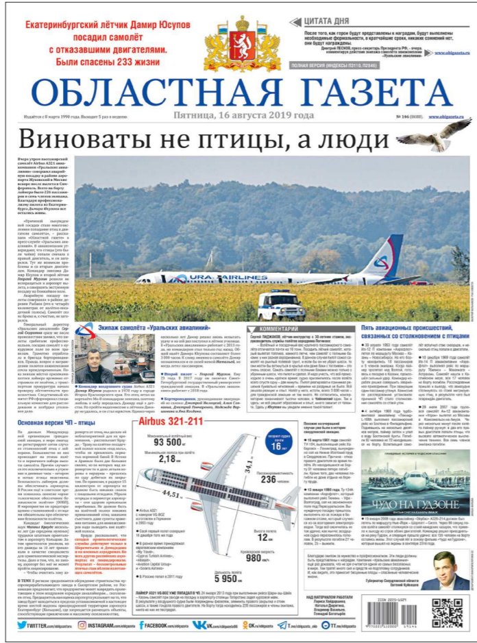
«Лучшая подача первой полосы»