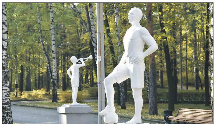
Будем надеяться, что свет в парке действительно включат, и о физкультуре и спорте тут будут напоминать не только скульптуры