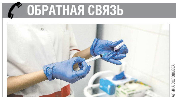
ОБРАТНАЯ СВЯЗЬ На этой неделе в Свердловскую область поступила новая партия вакцины от гриппа, так что прививочная кампания не останавливается