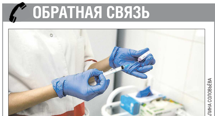
ОБРАТНАЯ СВЯЗЬ На этой неделе в Свердловскую область поступила новая партия вакцины от гриппа, так что прививочная кампания не останавливается