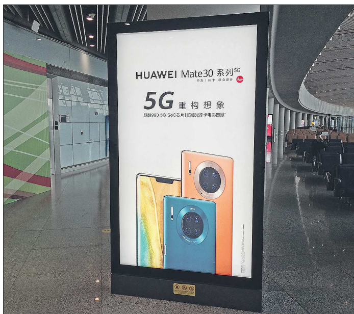
В аэропортах китайских городов уже можно встретить рекламу смартфонов 5G