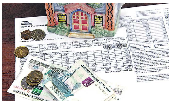
На Среднем Урале велика доля домов, построенных несколько десятилетий назад, поэтому взнос на капремонт занимает солидную часть в структуре коммунальных платежей екатеринбуржцев

Прошлая публикация «Область» о тарифах на коммунальные услуги в городах Свердловской области вызвала неподдельный интерес у наших читателей.