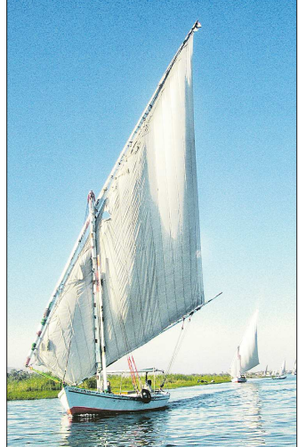
Слова родыгинского вальса «Заря, светлым светлом, Как люблю всё» вполне совпали с настроением уральцев и на акватории Нила, под парусом фелюки