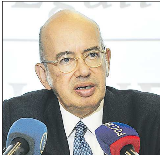
Пьер Леви до службы в России был французским послом в Польше и Чехии

По словам дипломата, он встретился с руководителями области и города, пред-