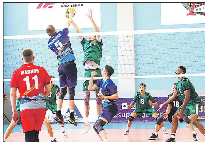
«Локомотив-Изумруд» на Кубке 75-летия Победы уже обыграл челябинское «Динамо», теперь необходимо закрепить успех уже в рамках Высшей лиги «А»