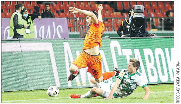
Для «Урала» поражение в Грозном стало третьим в сезоне

Футбольный клуб «Урал» потерпел третье поражение в сезоне. На выезде екатеринбуржцы без шансов уступили грозненскому «Ахмату» – 0:2.