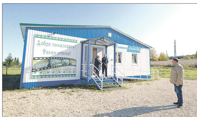
Новый модульный клуб обшлёлся властям округа в 2,8 млн рублей

В 1972 году увидел, как наши хоккеисты с канадками «реализовали» – Харламов, Петров, Михайлов ... И влюбился в этот вид спорта. Подражая им, встал на коньки, взял клюшку. На нашей