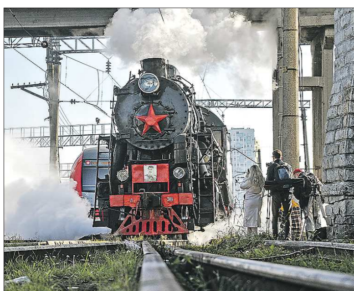
Паровоз Л-4372 был выпущен в 1954 году в Коломне, но даже спустя годы состоит из родных деталей почти на 70 процентов