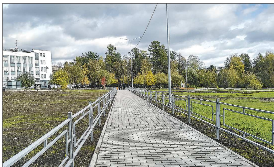
Дорожку, уложенную на месте любимой тропы пешеходов, жители иронично прозвали «взлётной полосой»

– Самый крупный объект благоустройства – парк Дворца культуры. Начинали там наводить порядок своими силами. После того как жители на рейтинговом голосовании выбрали этот парк, область выделила 70 миллионов рублей. В нём появятся аттракционы, зоны для