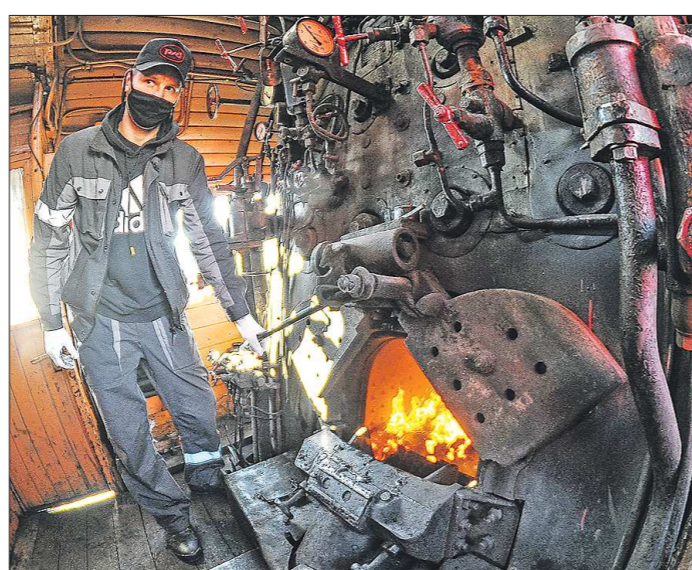
Уголь в топку паровоза для поддержания необходимого давления и температуры в котле нужно подбрасывать каждый час