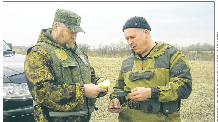
Пребывание в лесу и на транспорте с оружием и без необходимых для охоты документов приравнивается к браконьерству

вм зарядом явно вернее будет... — Я тоже так думаю, но есть и любители подобной охоты. Знаю случаи, когда из карабина «Вепрь» калибра 7,62 стреляли по боровой дичи. Теперь ввели вот такие ограничения.