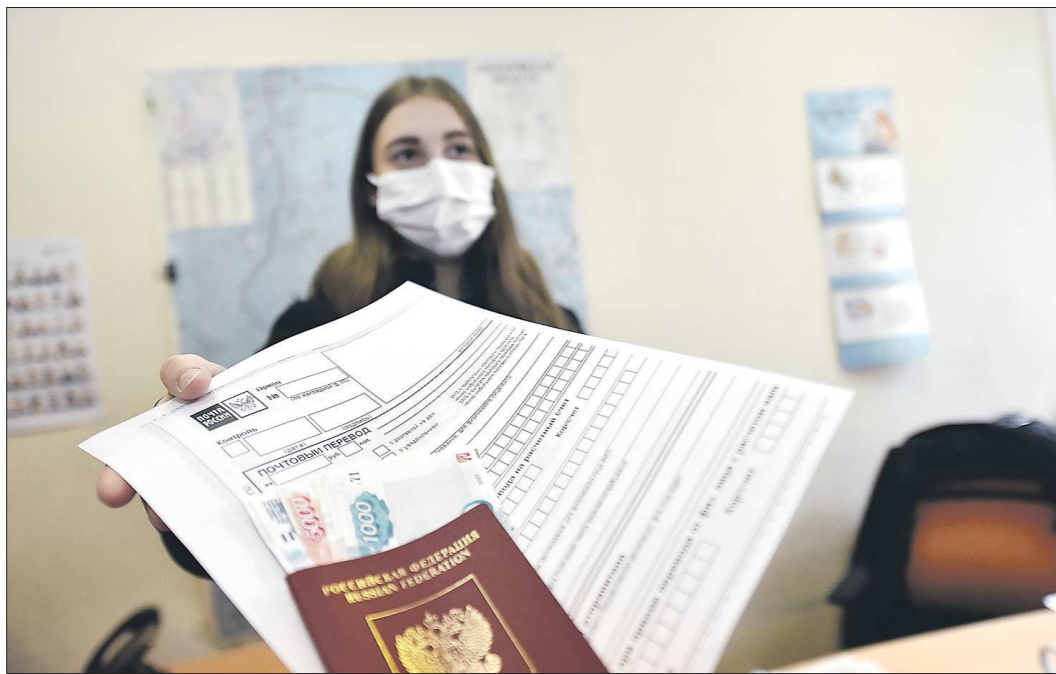
По новой системе выплата социальных пособий не будет зависеть от финансового состояния и притихи работодателя

Проект «Прямые выплаты ФСС» реализуется в стране с 2011 года. Первыми такой механизм выплат застрахованным в ФСС гражданам запустили в Карачаево-Черкесской республике и Нижегородской области.