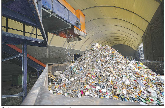
Сейчас мусор из уральской столицы отправляют на полигон «Северный», который практически исчерпал свои ресурсы