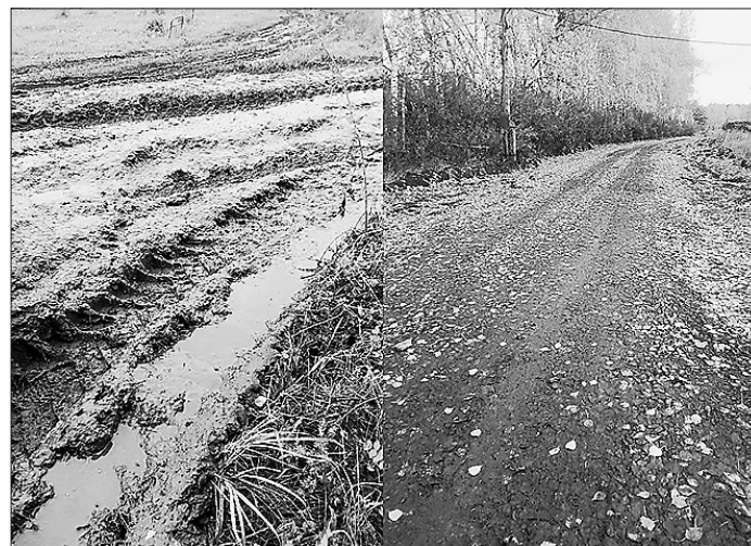
Рисунок 8 — До и после ремонта дороги в п. Кармак

Одним из наиболее ярких результатов работы проекта стало строительство дороги в п. Кармак. В начале августа 2019 года в Общественную палату Свердловской области обратились жители п. Кармак, расположенного на территории Тугулымского городского округа. Общественная палата Свердловской области обратилась в администрацию Тугулымского городского округа с просьбой рассмотреть возможность обустройства дороги в п. Кармак, в котором проживают более 260 человек. Уже к 10 сентября вся дорога по ул. Железнодорожной в п. Кармак отсыпана щебнем, который был выделен отделением железной дороги. Проведено грейдирование и расширение дороги (см. рисунок 8).