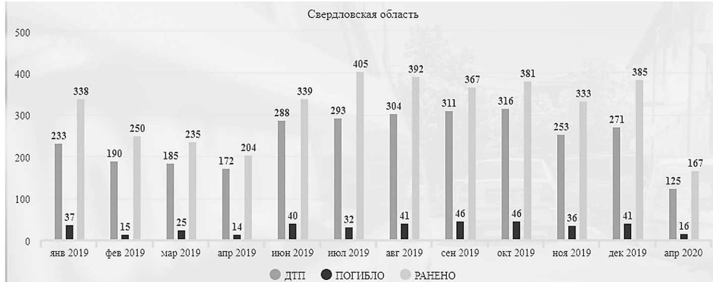
Рисунок 7 — Показатели количества ДТП в 2019 году 20