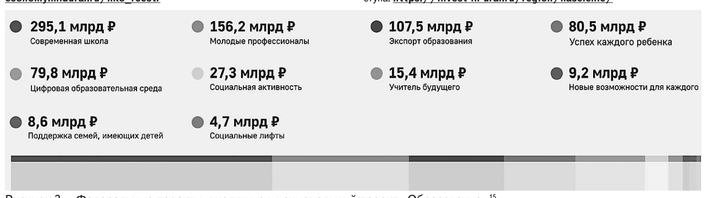
Рисунок 3 — Федеральные проекты, входящие в национальный проект «Образование» 15