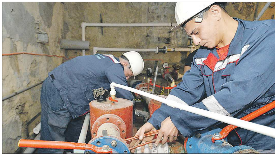
Сейчас в Каменском районе работают 6 угольных и 12 газовых котельных. Они давно нуждаются в ремонте

Теплосети Каменского городского округа переданы в концессию инвестору. С 2021 года он начинает реконструкцию муниципальных объектов теплоснабжения и горячего водоснабжения. Объём инвестиций в коммунальную инфраструктуру территории составит 500 млн рублей.