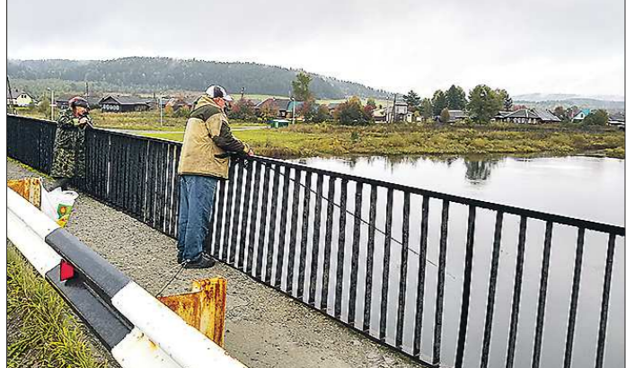
Усть-Утка стоит в окружении трёх рек, поэтому рыбалка здесь отменная

Подготовлено в соответствии с критериями, утверждёнными приказом Департамента информационной политики Свердловской области от 09.01.2018 №1 «Об утверждении критериев отнесения информационных материалов, публикуемых государственными учреждениями Свердловской области, в отношении которых функции и полномочия учредителя осуществляет Департамент информационной политики Свердловской области, к социально значимой информации».