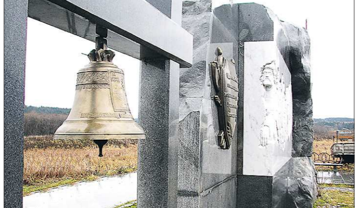
Каждый год 22 августа и 4 ноября над Чусовой слышится колокольный набат