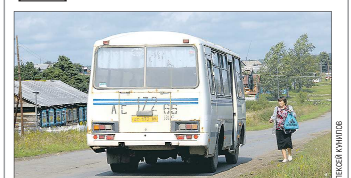
От посёлка Зайково до Ирбита можно добраться за полчаса, и большинство сельчан используют автобусы