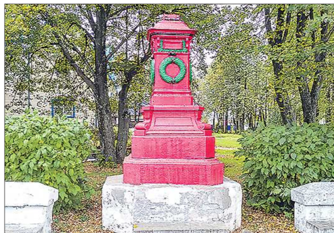
На постаменте после императора побывали Владимир Ленин и Глебуб. Вскоре его вернут Александру II

В посёлке Баранчинский, входящем в Кушвинский городской округ, за последние годы реализованы несколько крупных строительных проектов. Практически каждой стройке предшествовали обращения граждан в разные инстанции — от местной мэрии до приёмной Президента РФ. Сегодня баранчинцы лоббируют ещё две идеи — передачу местной дороги в областное подчинение и восстановление памятника императору Александру II.