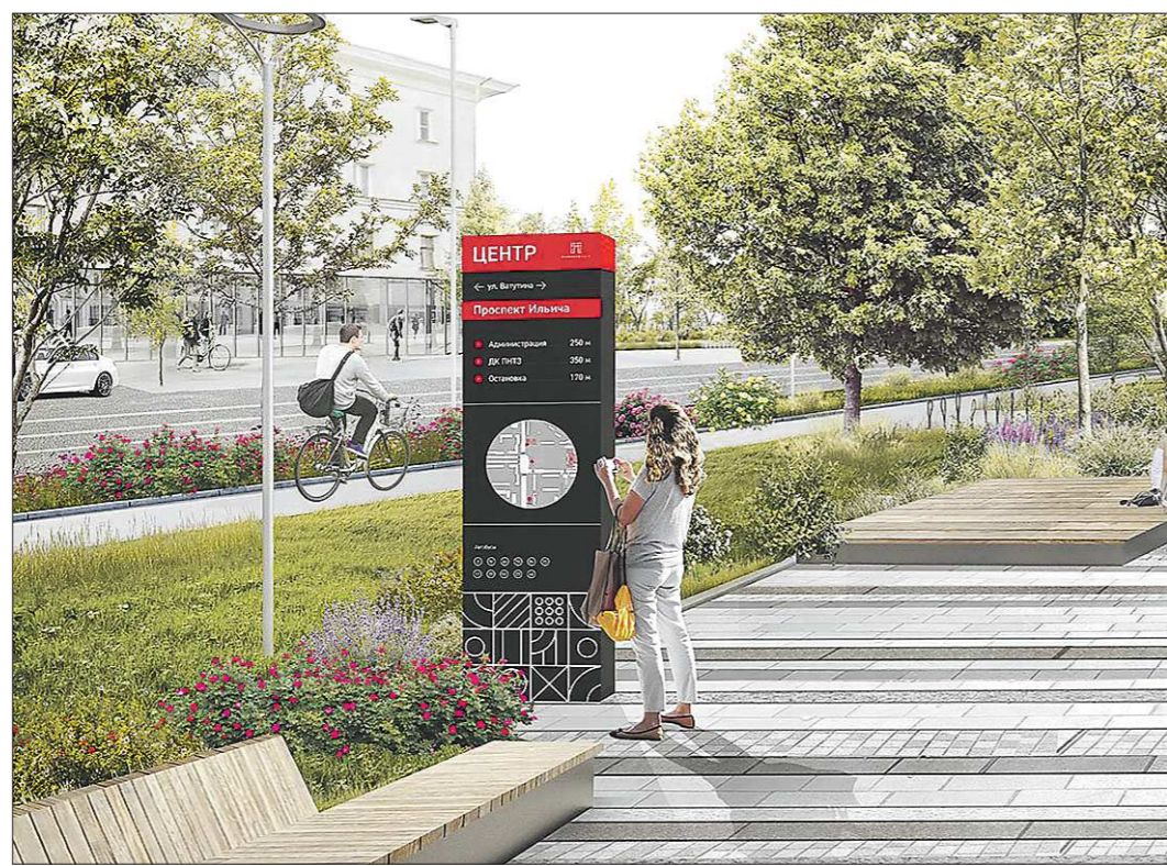
Так будут выглядеть навигационные стелы, оформленные в фирменном стиле Первоуральска