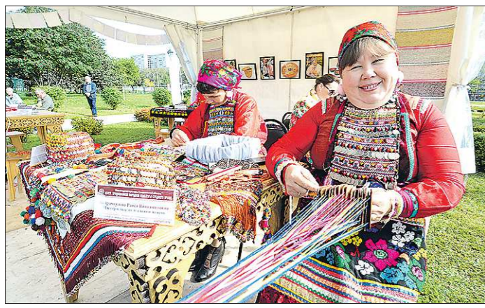
Некоторые НКО активно занимаются выпуском сувенирной продукции