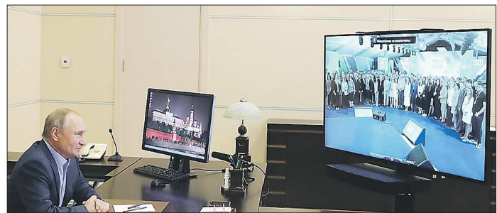
В этом году встреча прошла в формате видеоконференции

По итогам двух дней были выбраны те, кого ждёт год карьерных консультаций у одного из ведущих управленцев России и возможность стать