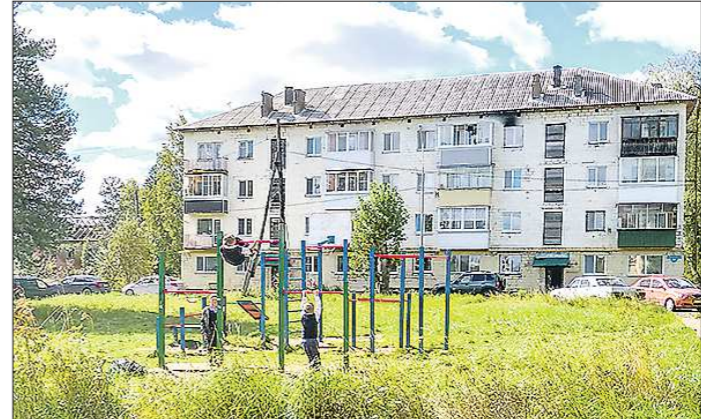
Одна из первых воркуват-площадок в Нижнем Тагиле была установлена в Покровском-1