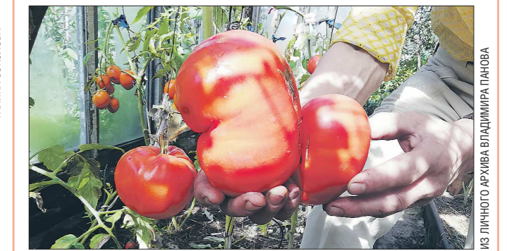
Уральские томаты в этом году уродились не хуже, чем кубанские или азербайджанские