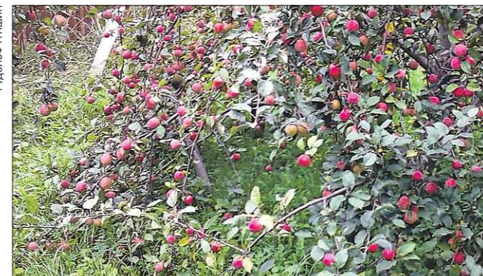
Яблоня сорта Экранное еле держит урожай – ветки с красными яркими плодами уже у самой земли