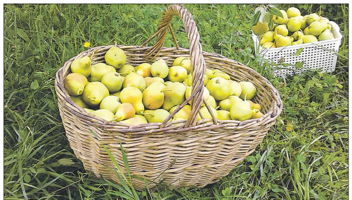
Груши сорта Пингвин отлично плодоносят на Среднем Урале – в этом году их много

Папирынтанное более нежное, чуть не досмотрел, не собрал вовремя – глядишь, уже яблоки по дорожкам. Зато все как на подбор – ровные, округлые, сразу видно, что предки у этого сорта непростые. Размер – некоторые экземпляры достигают 200 граммов. А главное, способны храниться три месяца после сбора, со временем становятся только слаще.