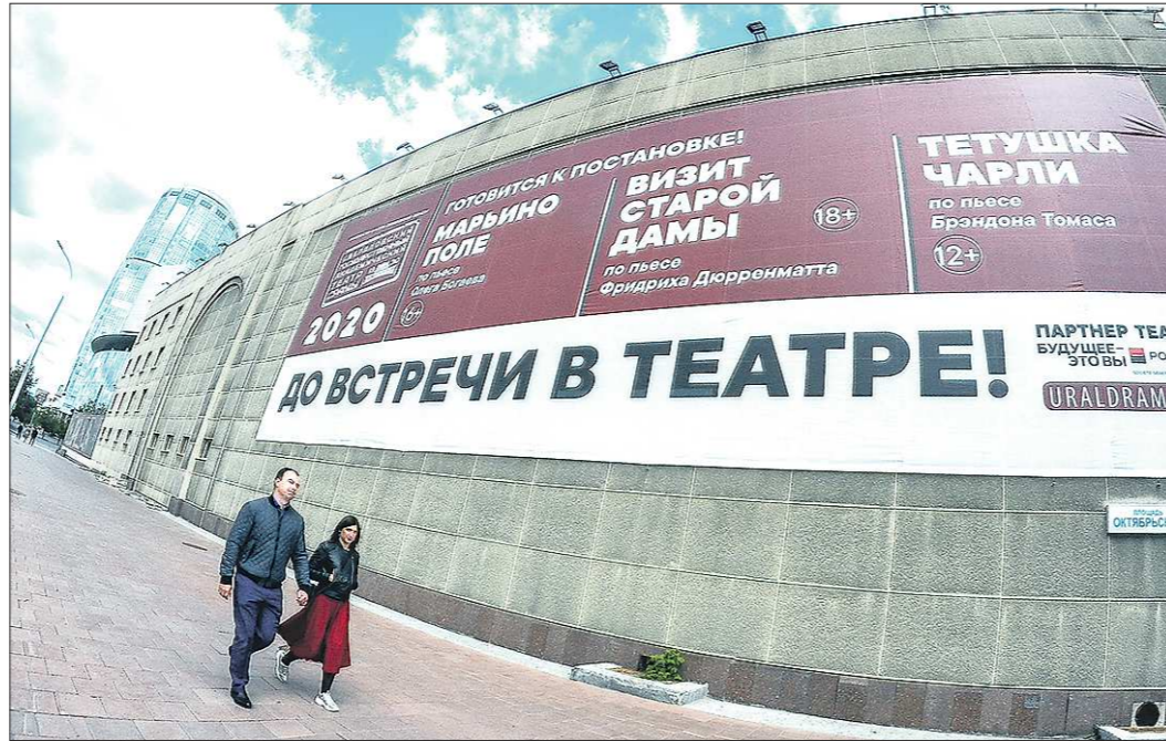
Конечно, работать театры начнут с ограничительными мерами. Одни из наиболее ощутимых для зрителя – масочный режим и запрет продажи продуктов питания, за исключением воды и напитков в промышленной упаковке

Екатеринбургский «Театрон», пожалуй, тот театр, который в пандемическую паузу действительно использовал все доступные (а порой и недоступные) шансы, чтобы проработать. Коллектив выступал практически каждый день на разных площадках – и в Летнем театре Литера-