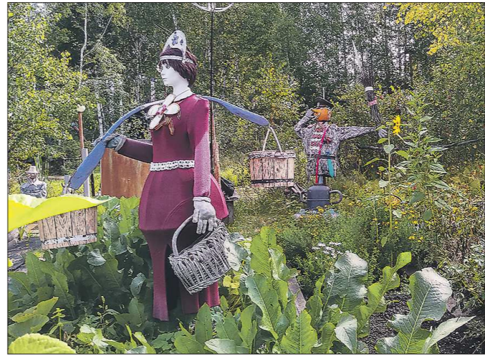
Красотку провожает взглядом бравый «маршал»

бёнка – запрет дневной или недельный (смотря какой была шалость) на посещение парка у Зеленцовых.