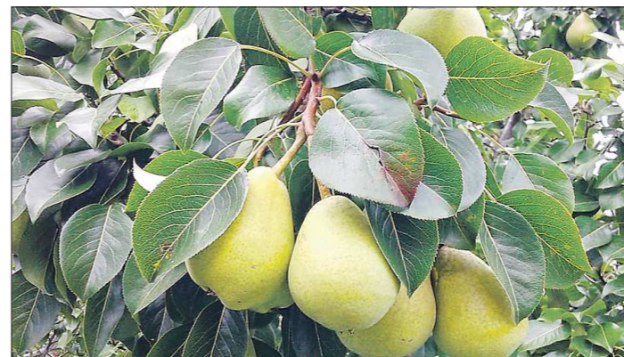
Груша Пермячка ещё повисит на дереве