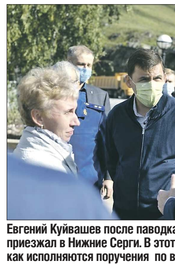
Евгений Куйвашев после паводка несколько раз приезжал в Нижние Серги. В этот раз он проверил, как исполняются поручения по восстановлению города

сти уделили не только благоустройству города, но и адресной помощи. Уже понятно, что некоторые дома по ул. паводка восстановить не удастся. Тем, кто лишился жилья, выплачено около 5 млн рублей. Оказали поддержку и тем, кто понёс частичные убытки: 600 человек получили по 15 тысяч рублей.